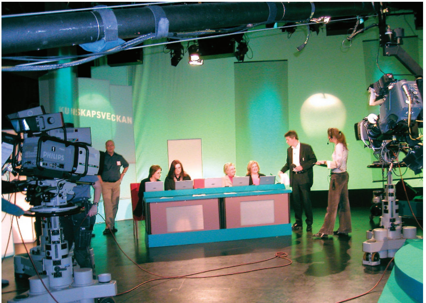
Journalisten Jens Orback ledde direktsändningen från Utbildningsradion i Stockholm.